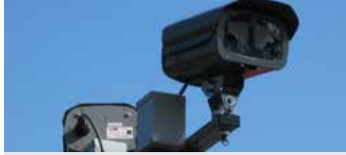
Veiligheid moet prioriteit zijn (p. 2)