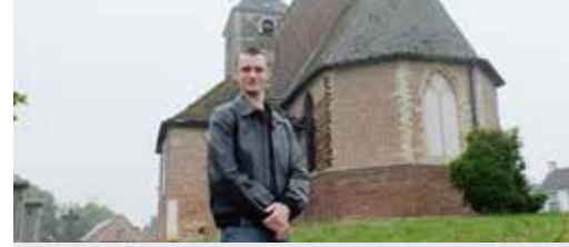
N-VA vraagt plan voor kerken (p. 3)