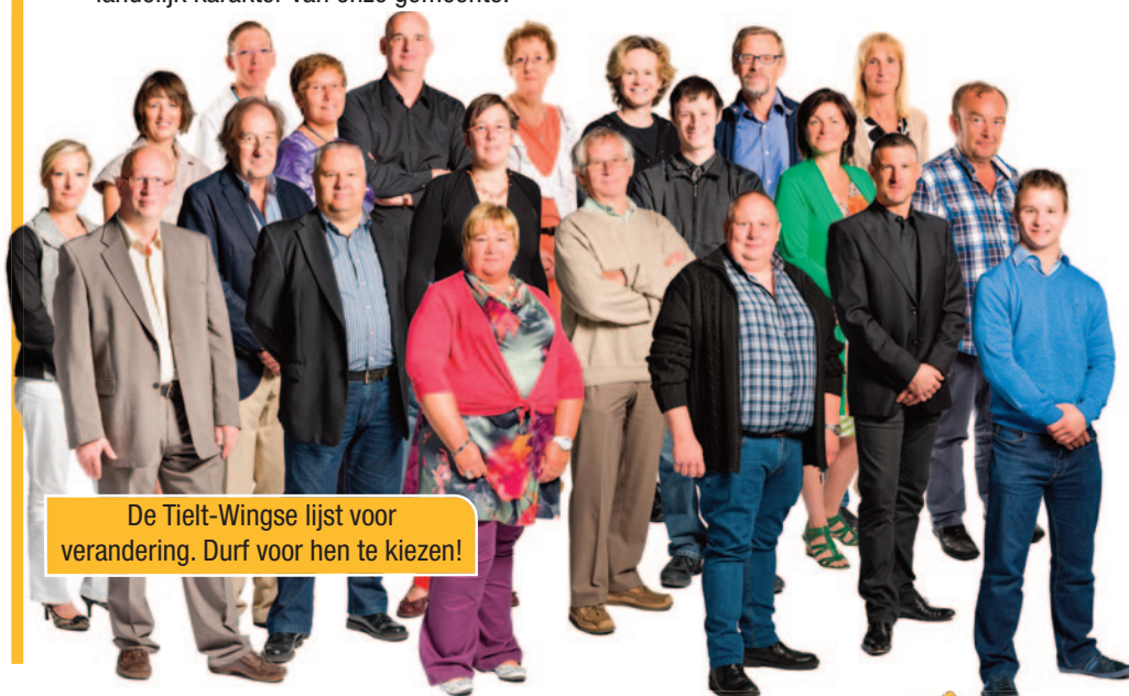
De Tielt-Wingse lijst voor verandering. Durf voor hen te kiezen!